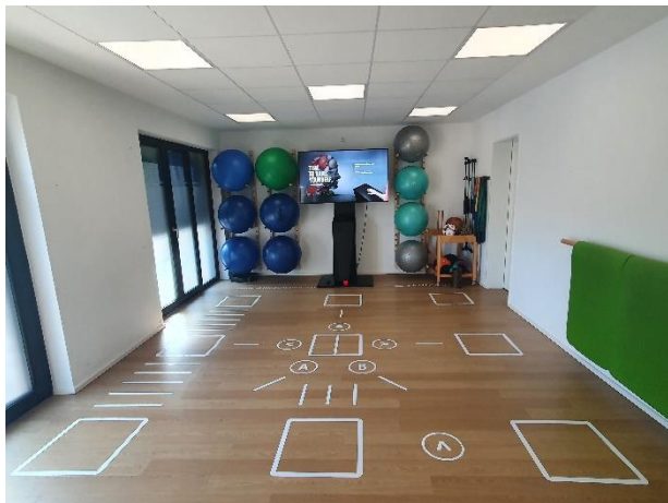
Gruppenraum mit Skillcourt und Kleingeräten