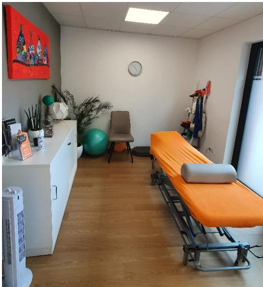
Große Behandlungsräume mit Laptops