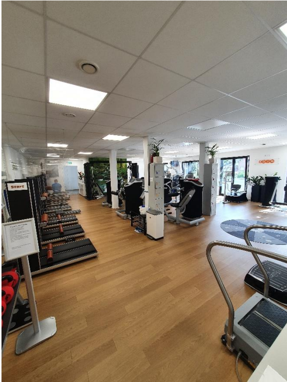
Trainingsraum mit Elym, Flexx, Doppelseilzug, u.v.m.